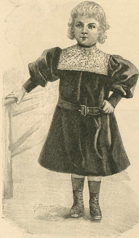
19.—Vestido para niñas y niños de 3 á 4 años.