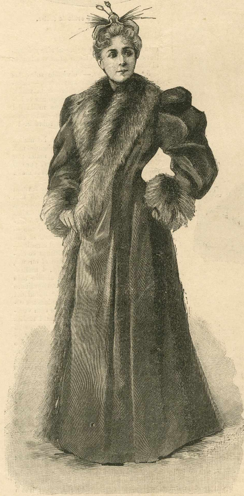
22.—Levita ancha de paño.