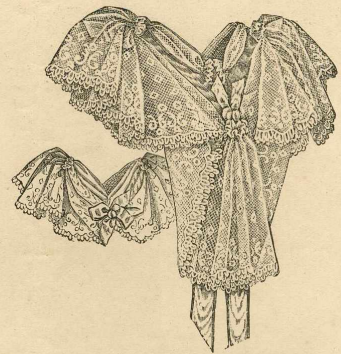
15 y 16.—Adorno para cuerpos escotados. Delantero y espalda.