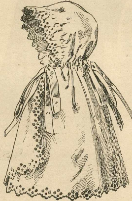
24.—Esclavina con capucha para niños pequeños.