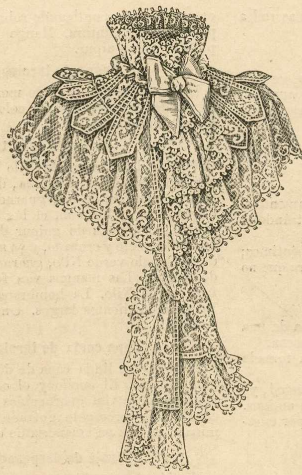
5.—Fichú de encajo.