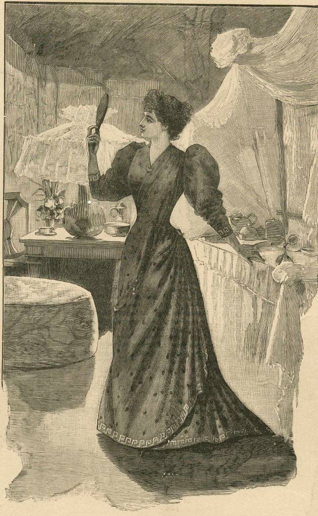
18.—Traje de recepción.