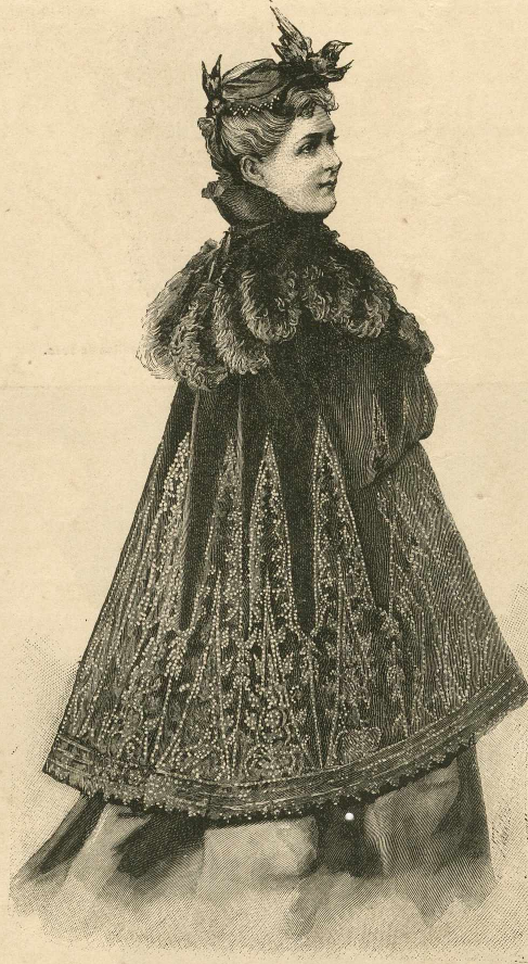
20.—Abrigo de terciopelo negro.