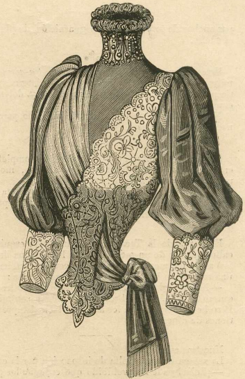
6.—Cuerpo de vestido para señoritas ó señoras jóvenes.