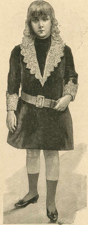
21.—Traje para niños de 4 á 5 años.