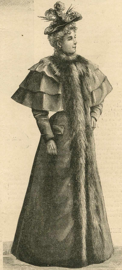
23.—Levita ajustada de paño.