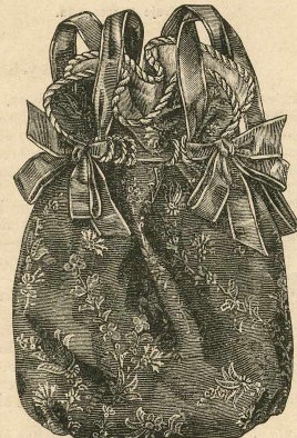
25.—Saco de seda antigua.