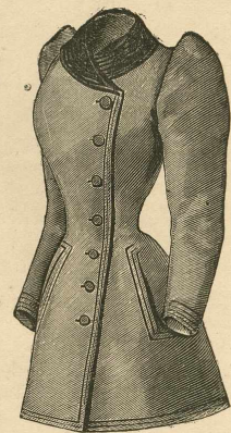
17.—Chaqueta á estilo de sastré.

traje blanco, sobre todo de crespón, y la forma preferida es á lo virgen, con ancho cinturón, anudado, á voluntad, á un lado ó detrás, y de un estilo de fácil ejecución.