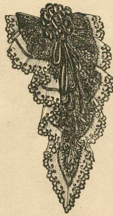
14.—Delantero de cuerpo de muselina de seda.