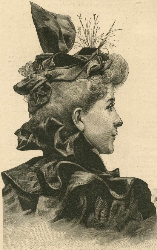
7.—Toque de terciopelo.