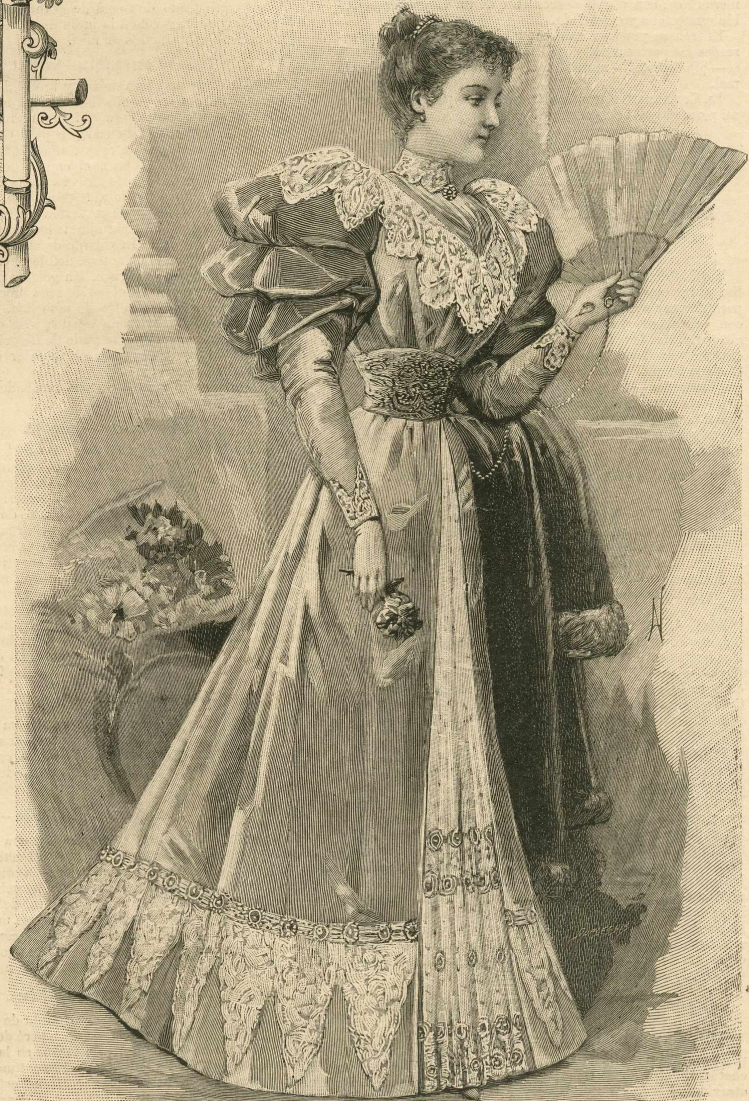
8.—Trajo de convite.