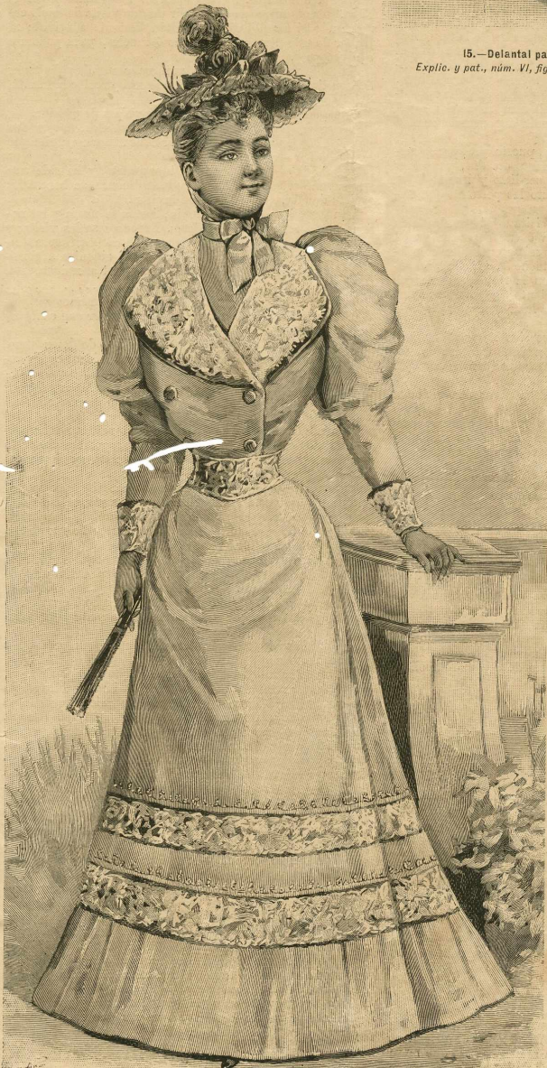
16.—Traje de calle.