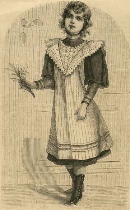
15.—Delantal para niñas de 6 á 8 años. Explic. y pat., núm. VI, figs. 41 á 45 de la Hoja-Suplemento.