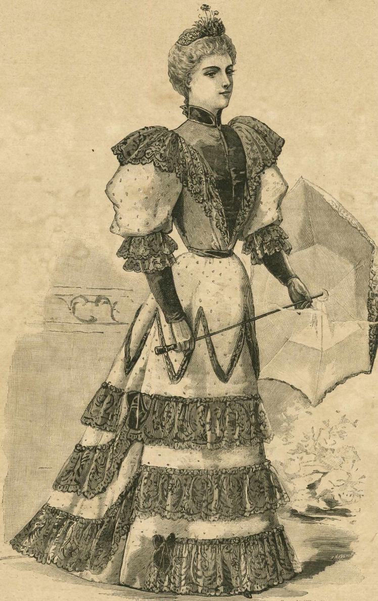
I.—Traje de visita.

Los abrigos que acompañan á estos trajes á la hora en que la brisa refresca son sumamente cortos, ligeros y graciosos. El tafetán tornasolado, cubierto de un encaje moreno enteramente bordado de oro y cachemira, de colores siempre finos y suaves; la muselina de seda festoneada, dispuesta en volantes muy voluminosos, y las cintas de raso negro, puestas en