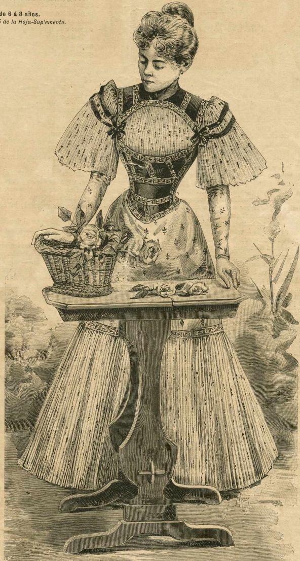
17.—Vestido de fular.