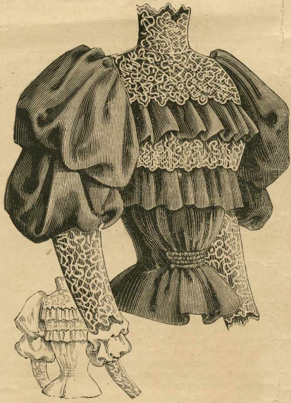
11 y 12.—Cuerpo-blusa de surah. Espalda y delantero.