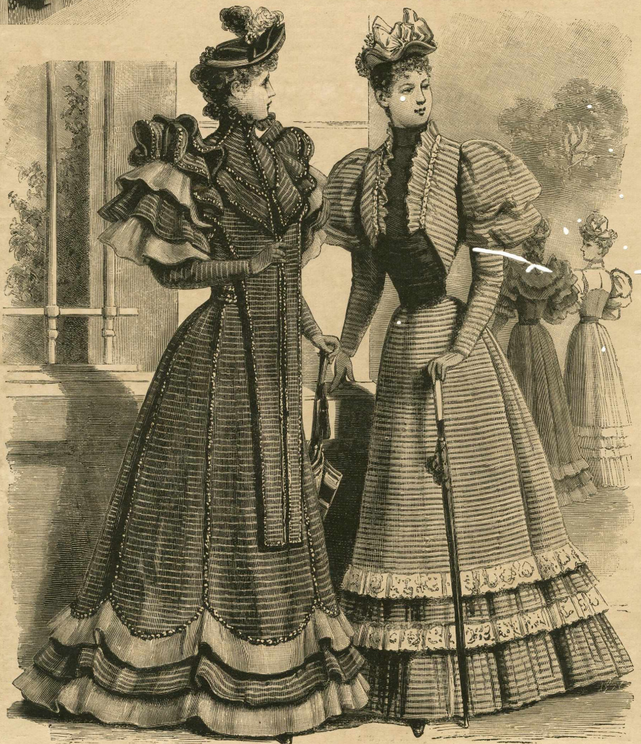
7 à 10.—Trajes de paseo. Delanteros y espaldas.