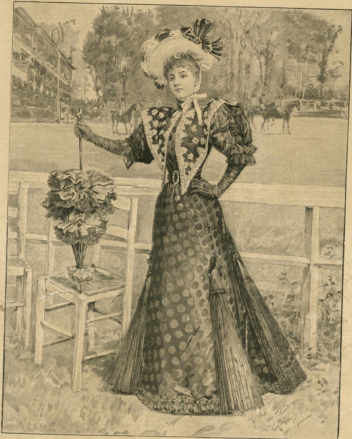
2.—Traje de carreras.