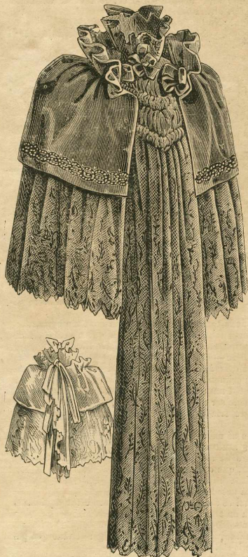
5 y 6.—Manteleta para señoras de cierta edad. Espalda y delantero.