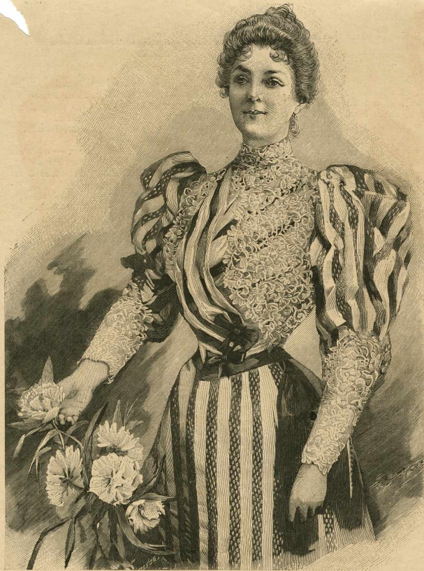
3.—Traje de recepción.