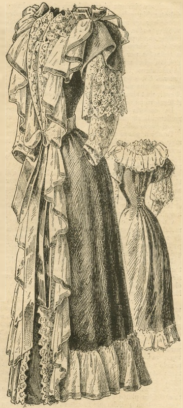
21 y 22.—Bata de crespón. Delantero y espalda.