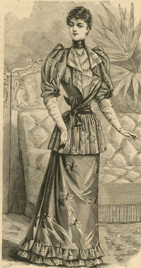
15.—Vestido de fular para señoras jóvenes.