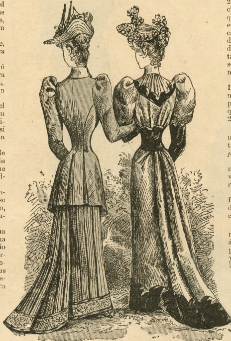
(Cropped) del figurin iluminado, visto de espalda.)

1. Vestido de crepón de lana azul pálido, adornado con terciopelo de verano azul oscuro.—Falda funda al bies por detrás, forrada de siciliana azul oscuro y adornada al borde con un bies de terciopelo cortado en ondas. Cuerpo blusa sujeto al talle con un ancho cinturón de terciopelo, y este cuerpo va escotado en redondo sobre una camiseta de surah crema, y bordado de terciopelo también cortado en ondas. Manga floja con puño ancho de terciopelo ondeado.—Sombrero de paja fantasia, con borde, sobre el ala, de botón de oro y amapolas, y adornado en la copa con choues de cinta de raso azul y roja.