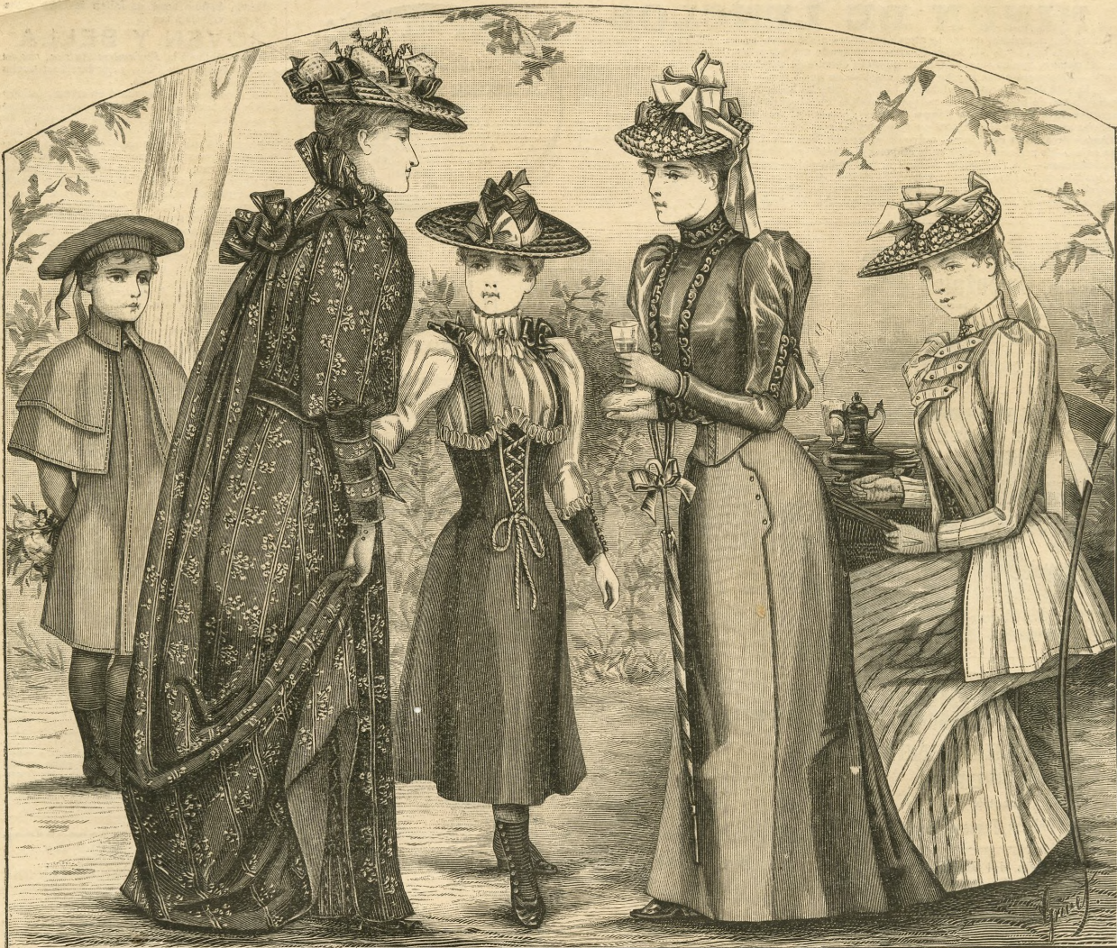
27.—Abrigo para niños de 4 á 6 años.

Explic. y pat., núm. IX, figs. 51 á 55 de la Hoja-Suplemento.