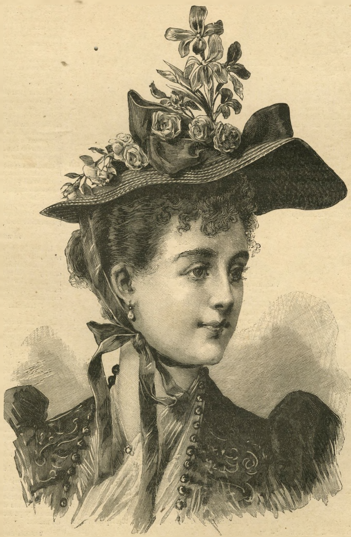
1.—Sombrero de paja.

He visto un vestido completo de seda escocesa color de rosa antiguo, azul antiguo y filititos de oro, de falda enteramente recta con un rizado de cinta en el borde inferior. El cuerpo, ajustado por delante y por detrás, iba abrochado en la izquierda bajo los brazos. Por encima, una chaquetilla «moco de café»