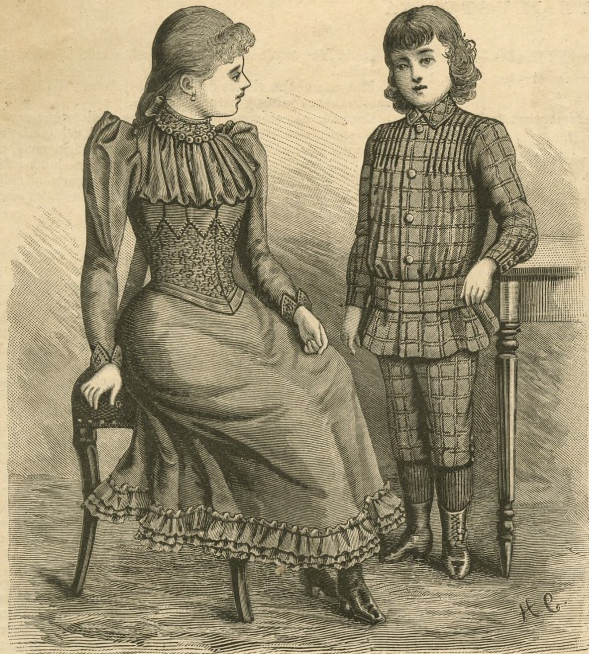
2.—Vestido para niñas de 12 á 13 años.

[ Explicación en el anverso de la Hoja-Suplemento.