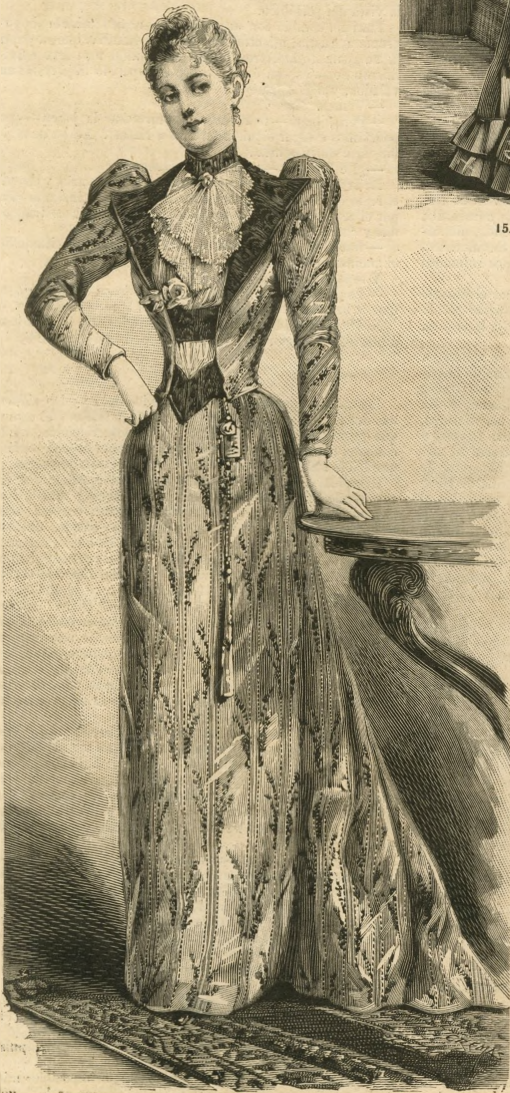
16.—Vestido de visita.