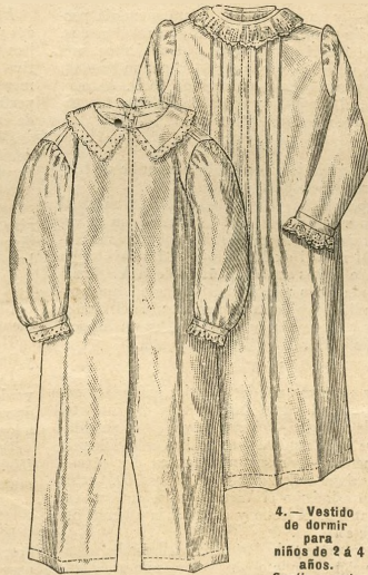
4.—Vestido de dormir para niños de 2 á 4 años.

Explic. y pat., núm. 11; figs. 18 á 20 de la Hoja-Suplemento.