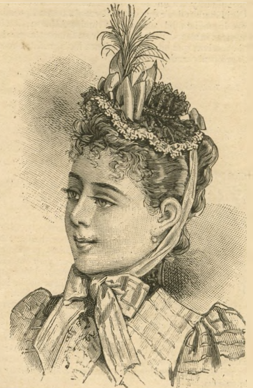
14.—Capota de encaje.