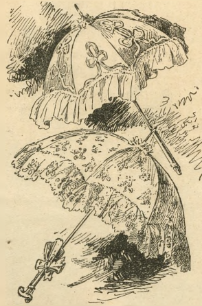
Núms. 4 y 5.

—Yo espero— le dijo su papá, felicitándolo— que ahora vas á continuar en tan buen camino.