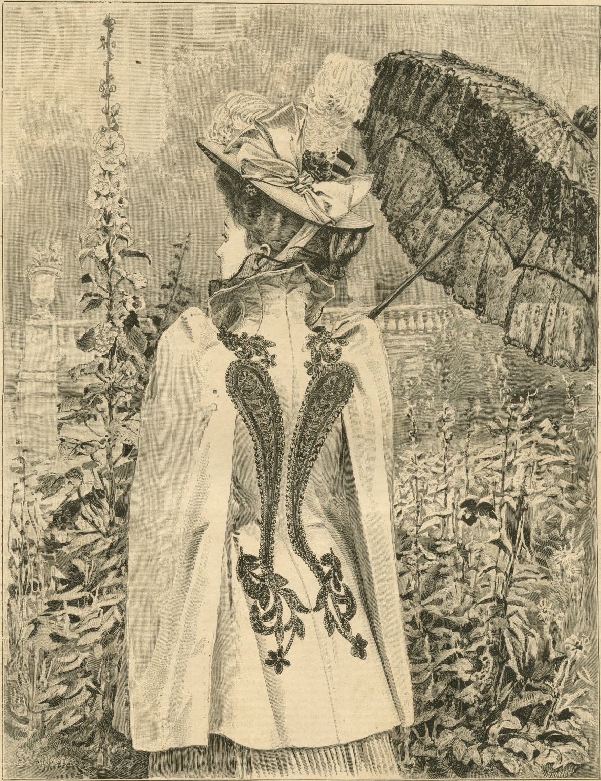
18.—Esclavina de cachemir y sombrero de paja.

vor á mirar á Floriana, y por toda explicación me dicen que por causas que no me importa conocer. ¿Qué me importaría entonces si esto no me importara? ¿Desobedeceré á mi padre? Jamás lo intenté siquiera; pero en la ocasión presente, si he de hacer sacrificio tan costoso, preciso será que me den razones claras, y sobre todo dignas de ser atendidas.