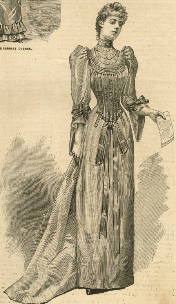
17.—Vestido de recibir.