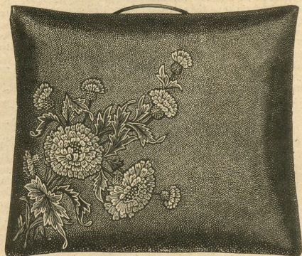
11.—Almohadón de viaje. Véase el dibujo 12.