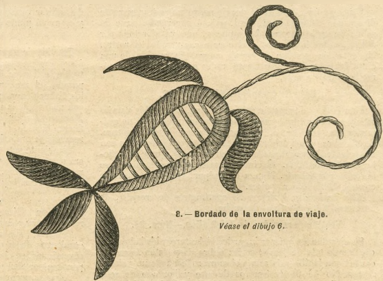
8.—Bordado de la envoltura de viaje. Véase el dibujo 6.

Explic. y pat., núm. V, figs. 27 á 29 de la Hoja-Suplemento.