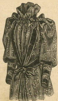
9.—Delantero del vestido de mañana. Véase el dibujo 28.1