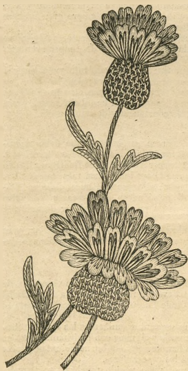
12.—Bordado del almohadón de viaje. Véase el dibujo 11.