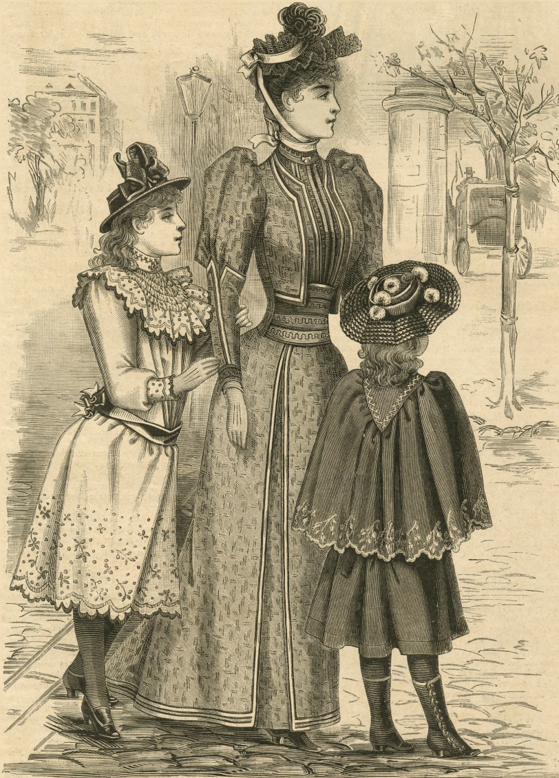
23.—Vestido para niñas de 7 á 9 años.