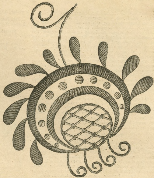
7.—Bordado de la envoltura de viaje. Véase el dibujo 6.

Explicación en el anverso de la Hoja-Suplemento.