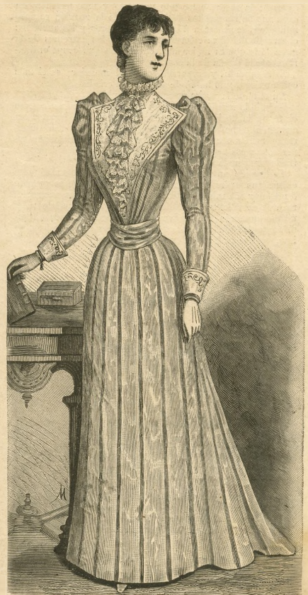
26.—Vestido de moaré-pekín. Explic. y pat., núm. II, fgs. 70 á 77 de la Hoja-Suplemento.

Explic. y pat., núm. IV, fgs. 21 á 26 de la Hoja-Suplemento.