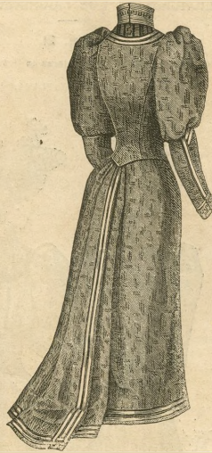
19.—Espalda del vestido de lana de mezclilla. Véase el dibujo 24.