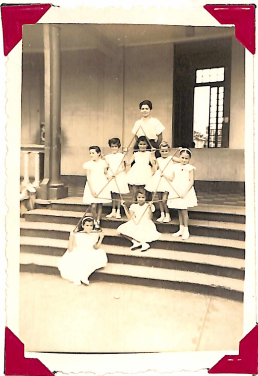
Las Niñas forman La Estrella de la Danza