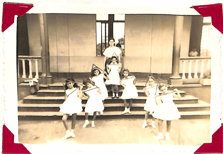
El Grupo en una de las poses de la Danza