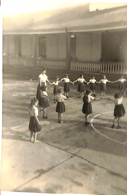
El grupo juega a: "El Ratón y el Gato"