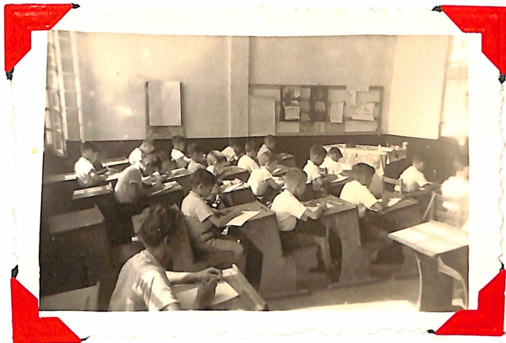
Aspecto general de la clase.-

Niños reconstruyendo el cuento "Tío Conejo y Tío Tigre por medio de dibujos.-