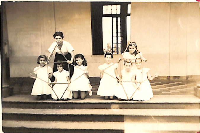
Las Niñas forman "LA VENTANA" en la Danza