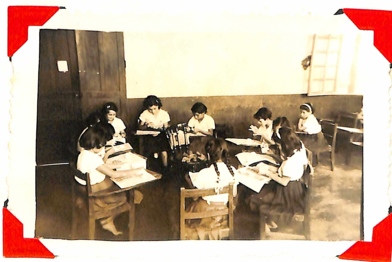
Grupo de Niñas modelando, al centro pueden observarse algunos objetos Indígenas.-