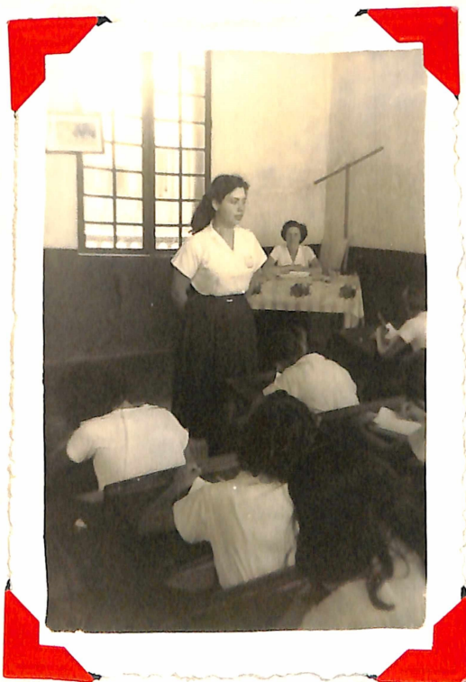
Observación del trabajo.-