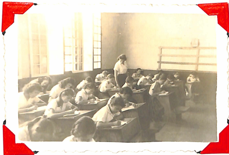
Un aspecto de la lección.-

-Fotografías tomadas durante la Práctica de Redacción, el día 17 de Abril de 1958-