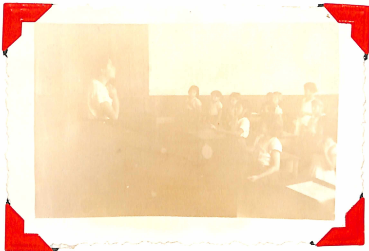
Declamando el Poema "MADRECITA"