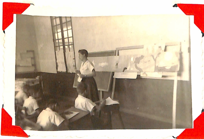
Otro aspecto de la lección, al fondo se aprecian láminas alusivas al cuento.-