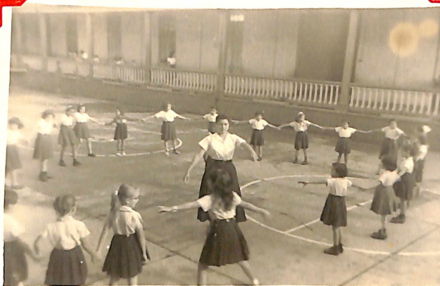
Las Niñas practican el Juego de: "La Niña Ciega"