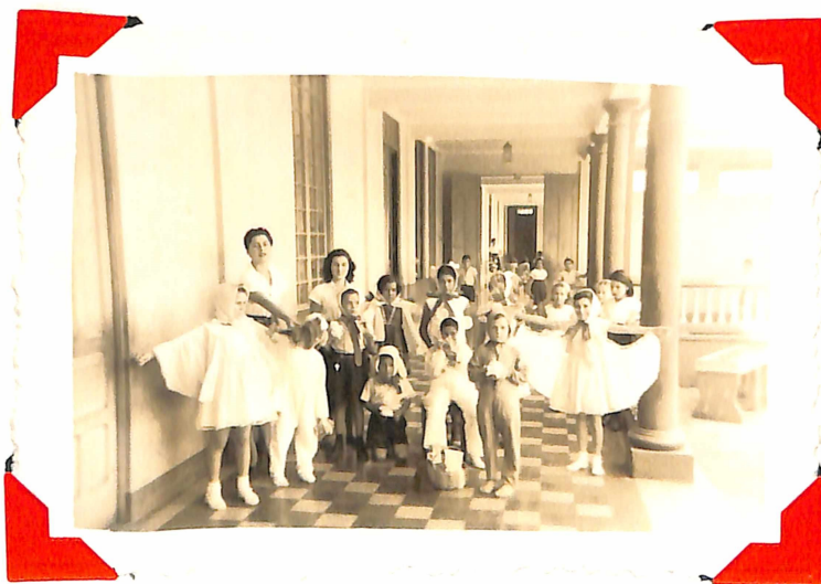
Grupo de los Animalitos que intervienen en la dramatización.-