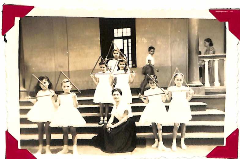
Otra pose del grupo en la Danza-(ensayo)