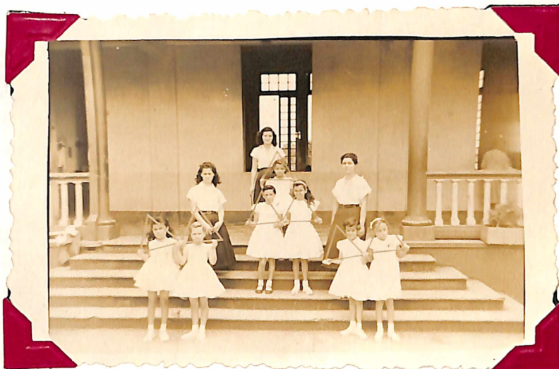
Las Niñas forman de dos en dos-IAZOS