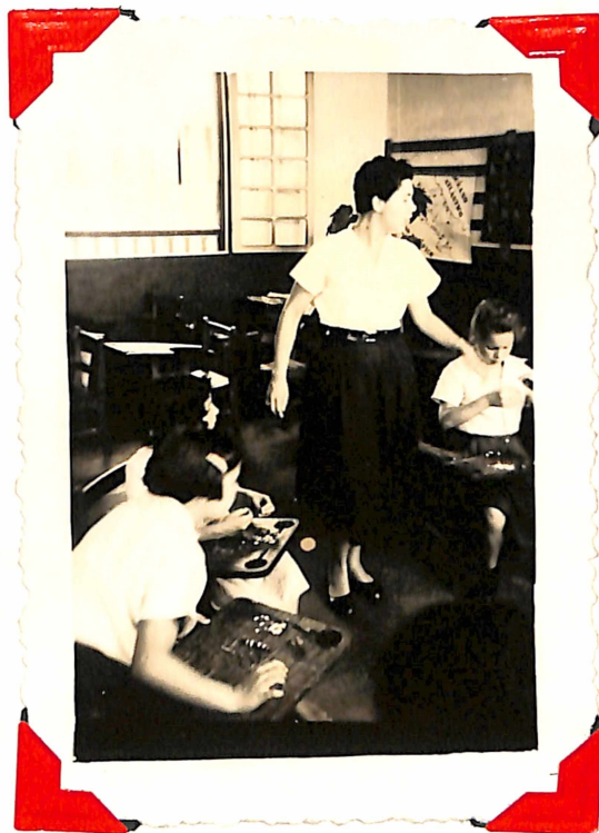
Observaciones sobre el trabajo.-