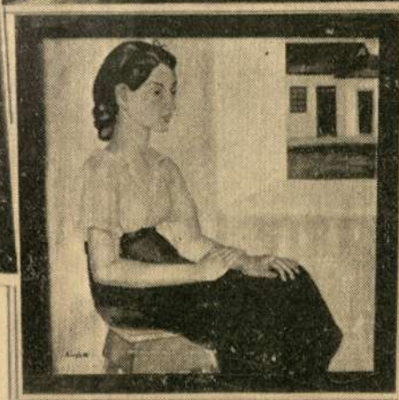
Medalla de Plata