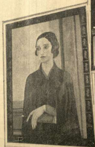
Gran Medalla de Oro PRIMER PREMIO