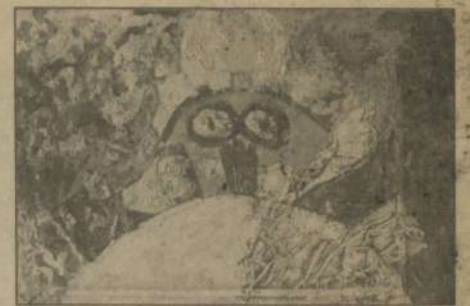
Galería Enrique Echandi.