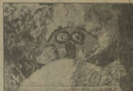
Galería Enrique Echandi.