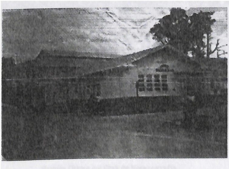
Escuela Otilio Ulate Blanco, Institución donde sus labores el colegio.