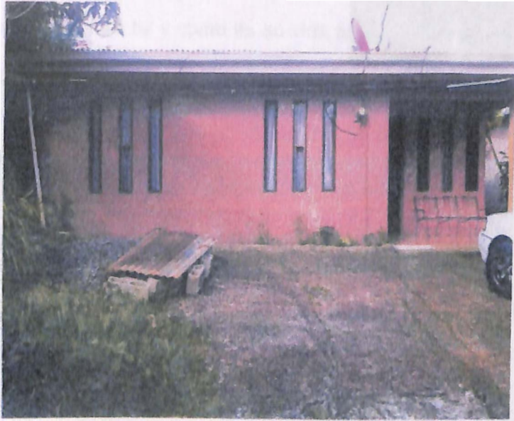
Foto5. Su casa de habitación