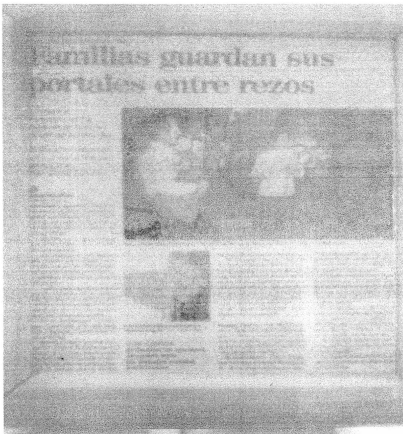
Foto 4. Rezos del niño. Publicación Periódico de Occidente, San Ramón

luego se iniciaba con el acto de contrición, luego se hacia un canto entre cada misterio y terminado el canto se iniciaba con el padre nuestro cantado, se terminaba con el quinto misterio, las tres ave maría, las letanias y por último el alabado a la virgen y al niño