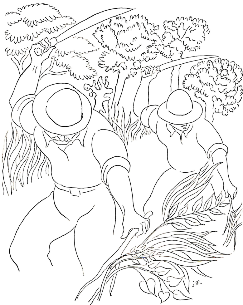
Orígenes y evolución de la ciudad de San Ramón.